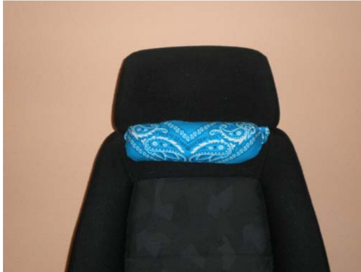
Vista frontal del rulo colocado.