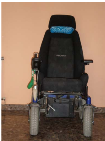
Vista general de la silla de ruedas con el rulo incorporado.